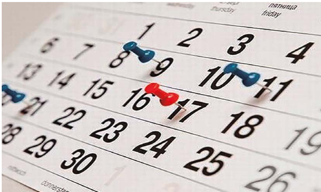
Calendário do Tribunal Superior Eleitoral, que rege o período eleitoral, é pré-determinado e não abre concessões

8 de abril é o prazo para que eleitoras e eleitores domiciliados no Brasil que não possuem cadastro biométrico na Justiça Eleitoral solicitem alistamento, transferência e revisão pelo serviço de autoatendimento eleitoral na internet. Jovens que queiram tirar o primeiro título de eleitor também devem iniciar seu alistamento pelo autoatendimento eleitoral até 8 de abril.