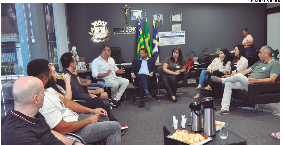
Entre os pedidos feitos aos legisladores está a criação de prazos para repasses dos recursos públicos aos projetos