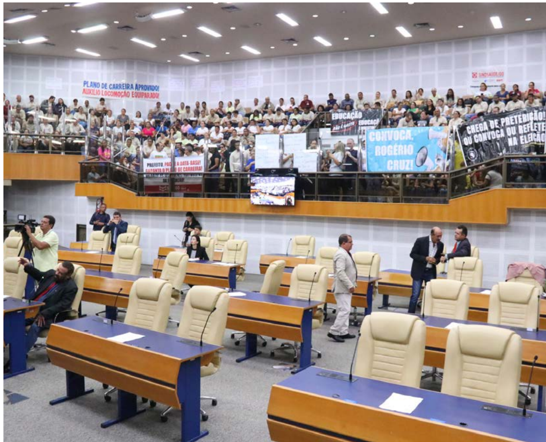
Vereadores da Câmara Municipal de Goiânia buscam novos partidos

Em 2018, o Tribunal Superior Eleitoral (TSE) decidiu que somente os eleitos em fim de mandato vigente poderão fazer a migração de legenda. Dessa forma, a regra abrange vereadoras e vereadores eleitos em 2020 e que vão se candidatar no pleito de outubro. Deputadas e deputados eleitos em 2022 só poderão usufruir da medida em 2026.