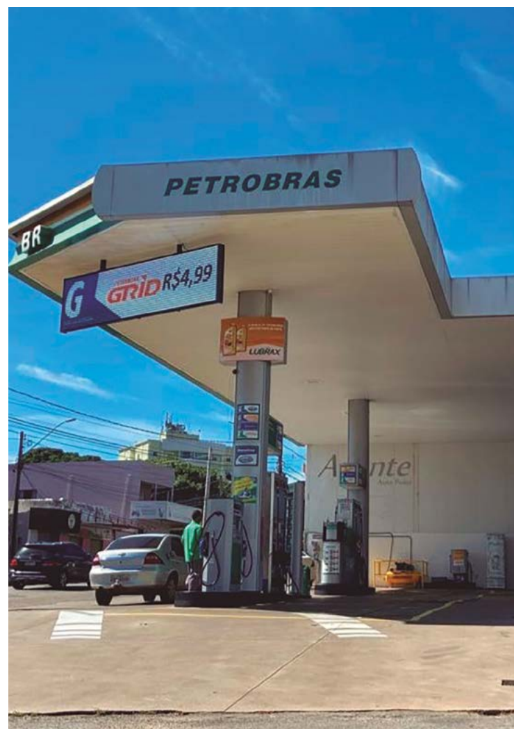
Levantamento aponta que o brasileiro utilizou, em média, 6,4% de sua renda para abastecer um tanque de 55 litros com gasolina

Em 2022, o índice apresentou um aumento de 0,5 ponto percentual, quando os impostos sobre os combustíveis foram retirados em meio à campanha eleitoral para a Presidência da República. Vale ressaltar que, na região Centro-Oeste, o custo para abastecer um tanque de gasolina comum representou o menor percentual do país em outubro, novembro e dezembro de 2023: 5,2% da renda média domiciliar mensal. Contrastando, foram observados percentuais mais elevados no Nordeste (10,7%) e Norte (8,6%).