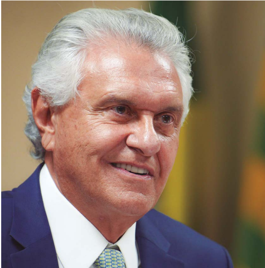
Ronaldo Caiado é tido como nome em potencial em possível federação de União Brasil, PP e Republicanos

Com 40 anos dedicados a pautas conservadoras, governador de Goiás é alçado para viabilizar pré-candidatura à presidência