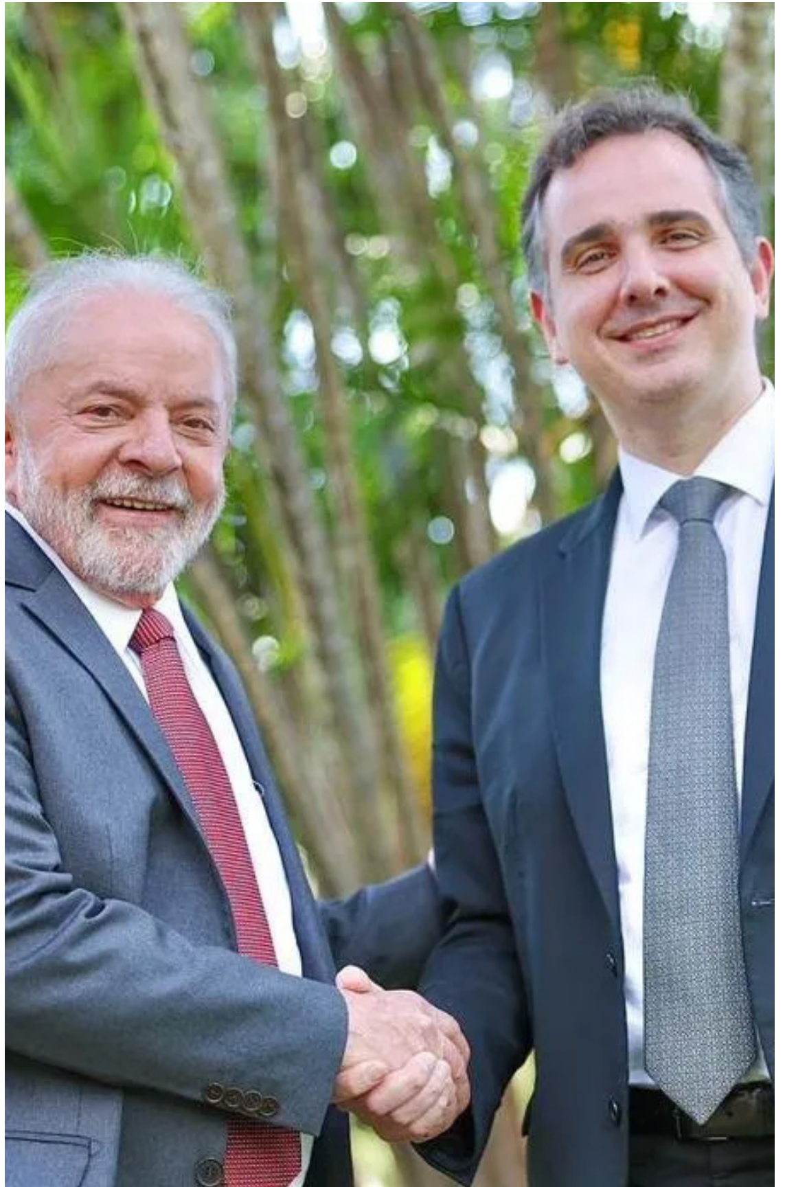
Lula da Silva (PT) e Rodrigo Pacheco (PSD/MG): diálogo e parceria sobre projetos no Congresso

A nova relação Lula-Lira foi acertada entre ambos em reunião no Palácio da Alvorada, no dia 9 de fevereiro, depois do duro discurso feito pelo deputado na abertura do ano legislativo. Lira conseguiu um canal direto com o presidente da República por meio do celular de um de seus assessores, além do aval para tratar das pautas da Casa diretamente com o ministro Rui Costa (Casa Civil) em detrimento de Padilha.