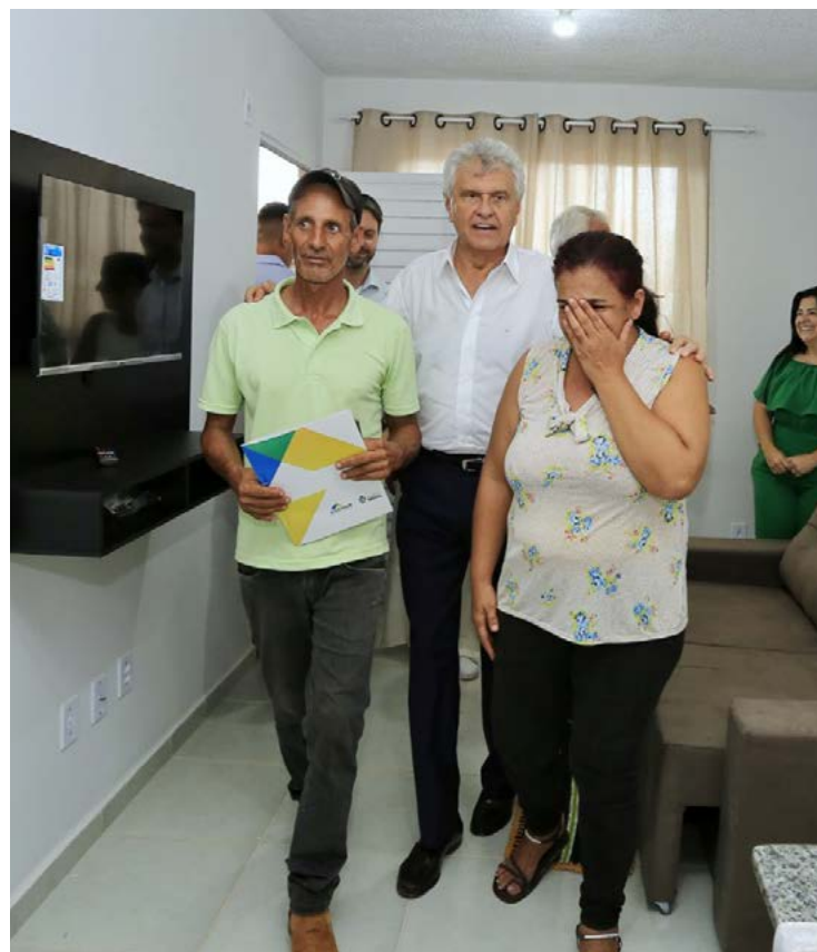
Moradores ganham chave e escritura do governador Ronaldo Caiado: programa tem meta de construir 10 mil unidades

Presidente da Agehab, Alexandre Baldy afirmou que o programa garante "proteção social": "chega a quem não tem condição de pagar prestação por mês, é custo zero mesmo".